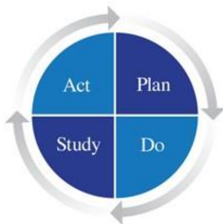
Figuur 1 Cyclus Plan, Do, Study, Act (PDSA)